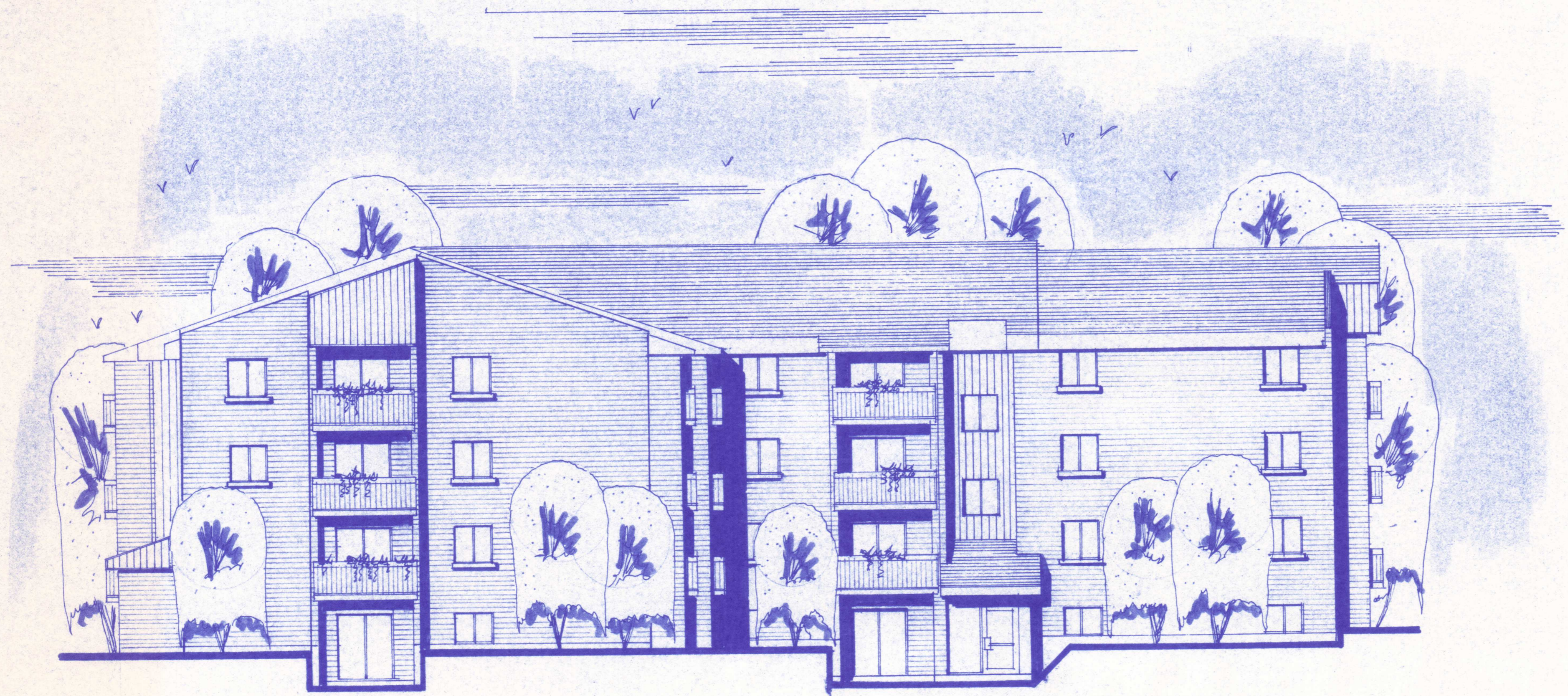
ELEVATION RUE DU LAC